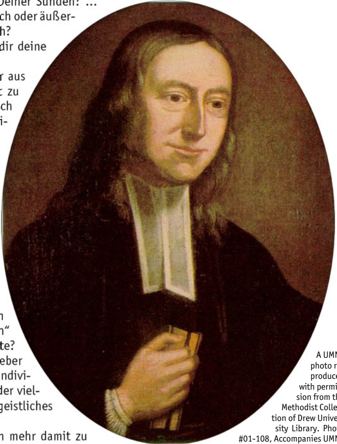
Photo #01-108, Accompanies UMNS story #, 7/11/01